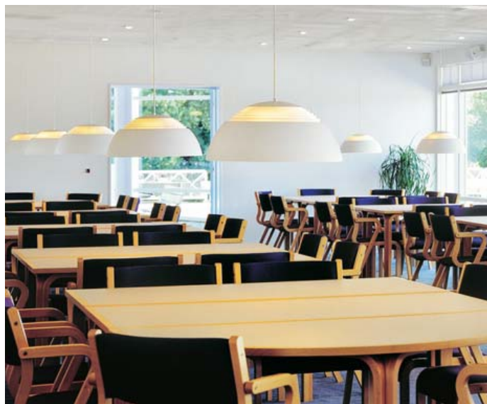
Færggården, Juelsminde, Danmark.