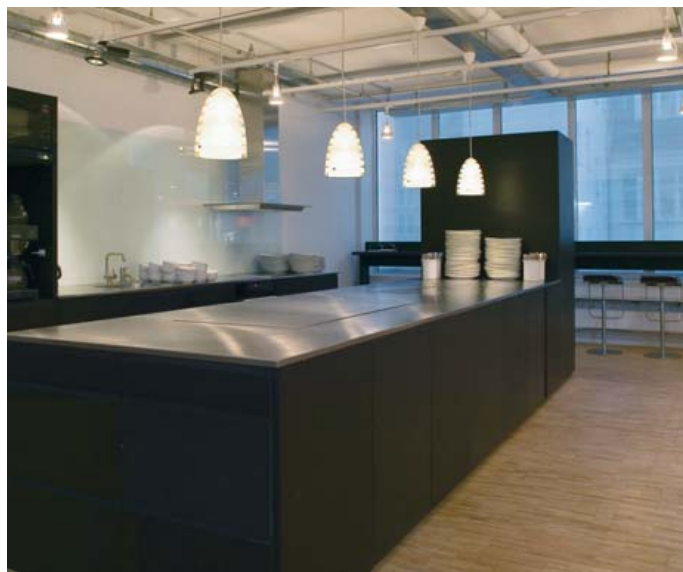
Louis Poulsen Lighting A/S Hovedkontor. København, Danmark. Arkitekt: PLH arkitekter as. Ljusdesigner: Louis Poulsen Lighting A/S.