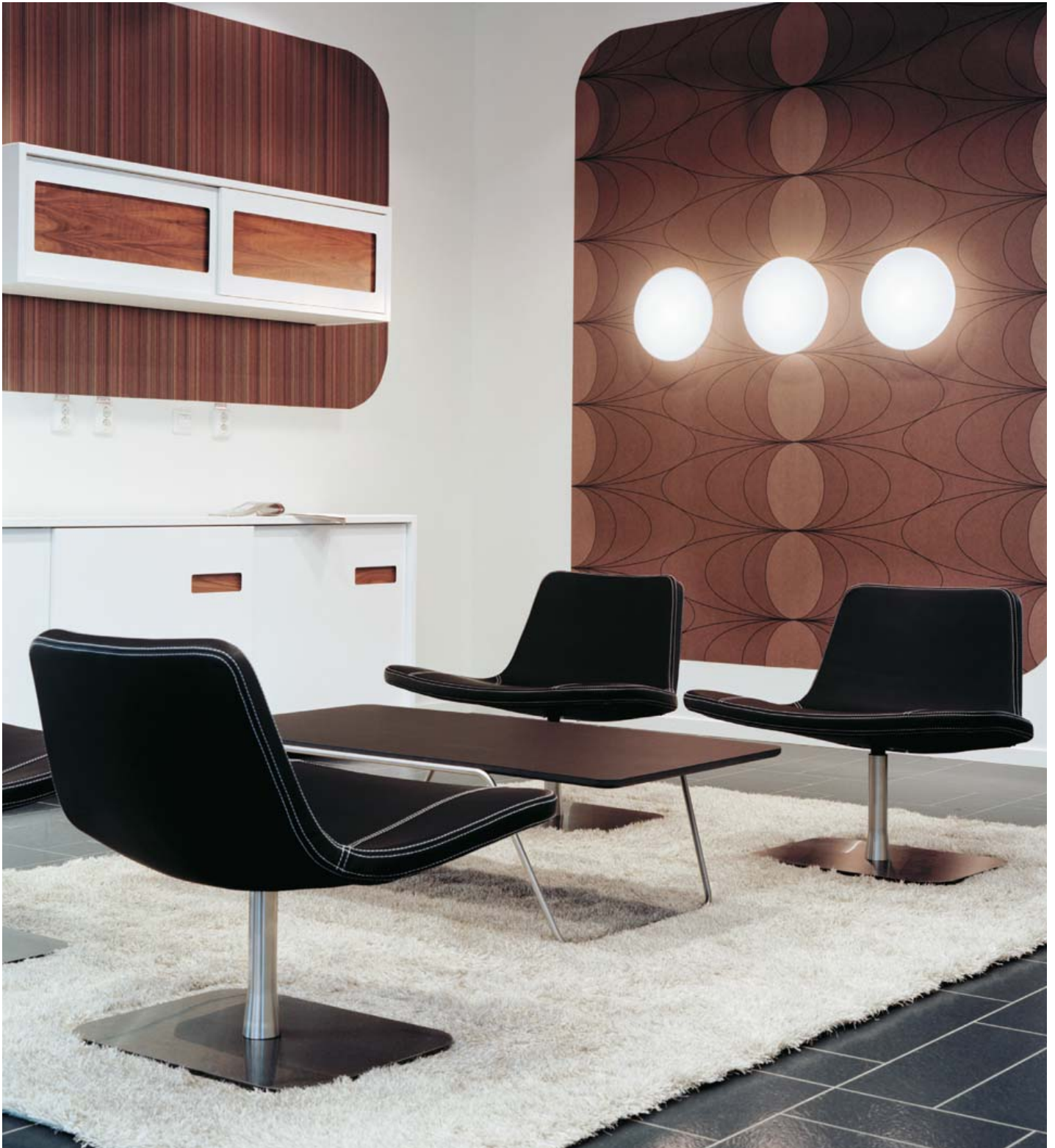
Riviera Markiser & Persienner AB Partille, Sverige Arkitekt Thorbjörnsson+Edgren Arkitektkontor Ljusdesigner Thorbjörnsson+Edgren Arkitektkontor